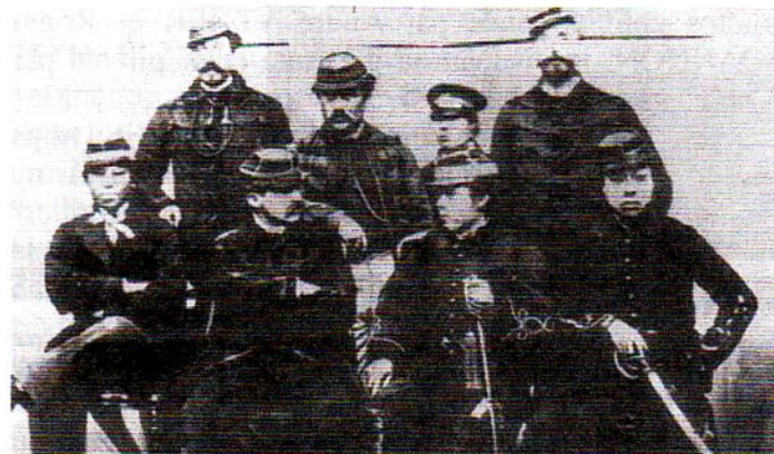
Jules Brunet (2 e à partir de la gauche au premier rang) était un capitaine, engagé pour moderniser l'armée du Japon à la fin du 19 e siècle, au moment de la restauration Meiji.